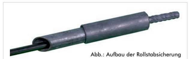
Abb.: Aufbau der Rollstabsicherung