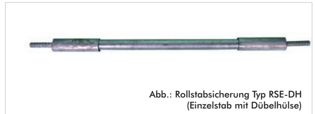
Abb.: Rollstabsicherung Typ RSE-DH (Einzelstab mit Dübelhülse)